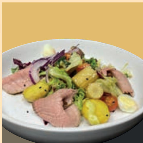
САЛАТ С РОСТБИФОМ И БЕБИ КАРТОФЕЛЕМ - 215gr