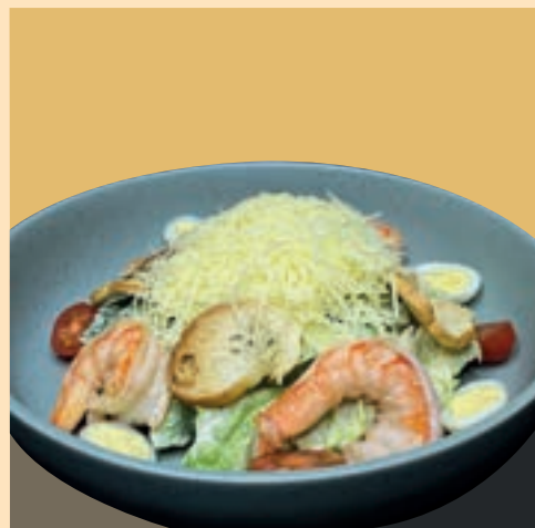
ЦЕЗАРЬ С КРЕВЕТКАМИ - 240gr