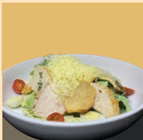
ЦЕЗАРЬ С КУРИЦЕЙ - 215gr