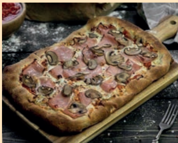
ПРОШУТТО- 20/30sm 420gr