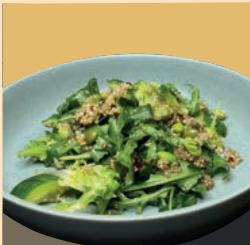
САЛАТ ЗЕЛЕНЫЙ С КИНОА - 200gr

НА ВЫБОР ЛЕГКИЕ, СЫТНЫЕ И ПИАТЕЛЬНЫЕ САЛАТЫ ОТЛИЧНЫЙ ВЫБОР ДЛЯ ЛАНЧА ИЛИ УЖИНА.