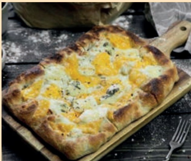
ПИЦЦА ЧЕТЫРЕ СЫРА - 20/30sm 360gr